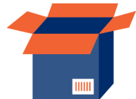
GTIN des Case mit 6 x Multi-Pack mit je 3 Gläsern

Gerne steht Ihnen das Team von GS1 für weitere Fragen zur Verfügung.