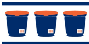
GTIN des Multi-Pack mit 3 Gläsern